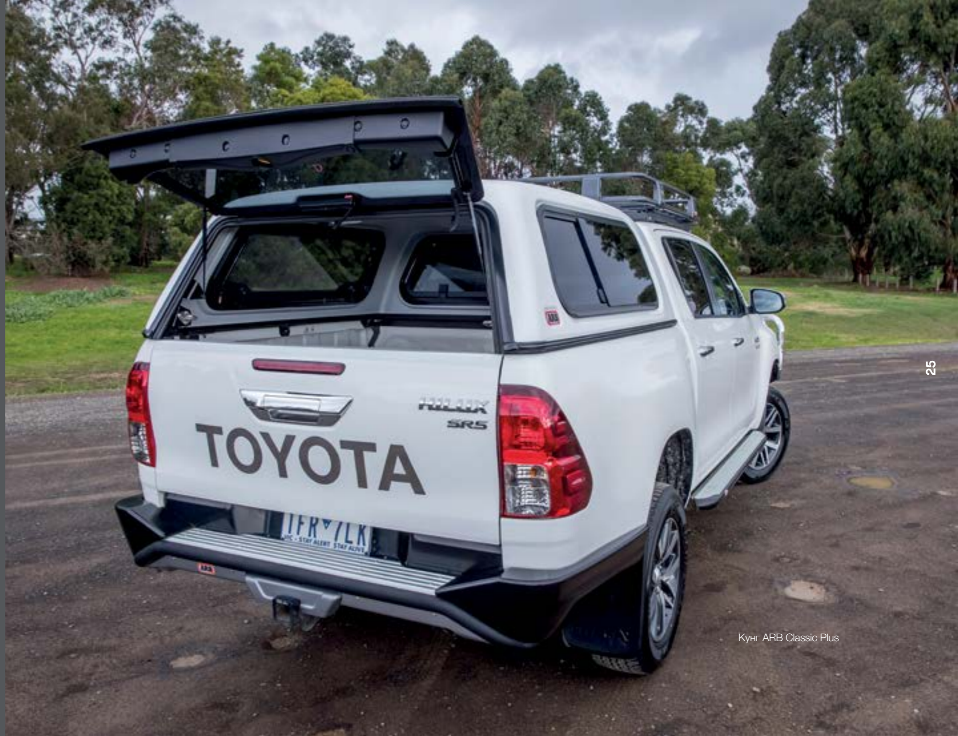
Кунг ARB Classic Plus