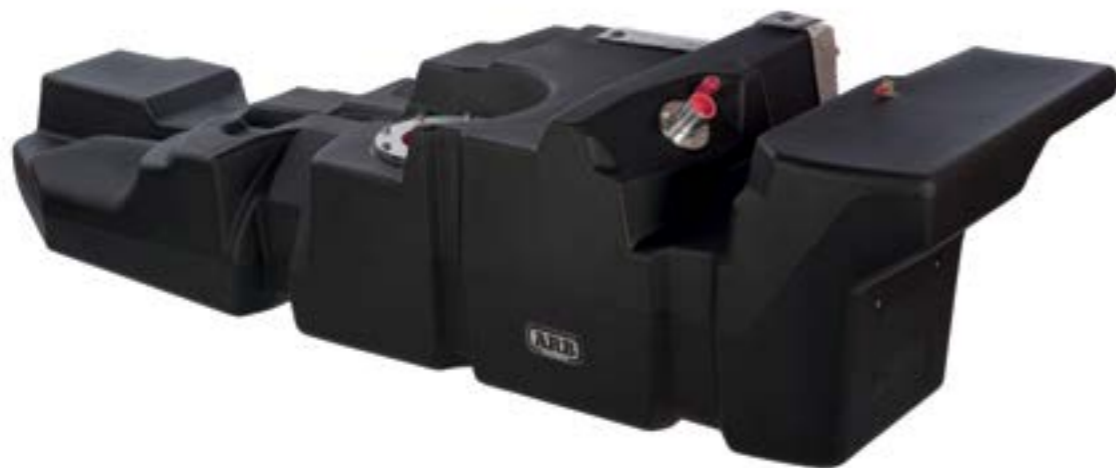
Бак ARB Frontier для HiLux